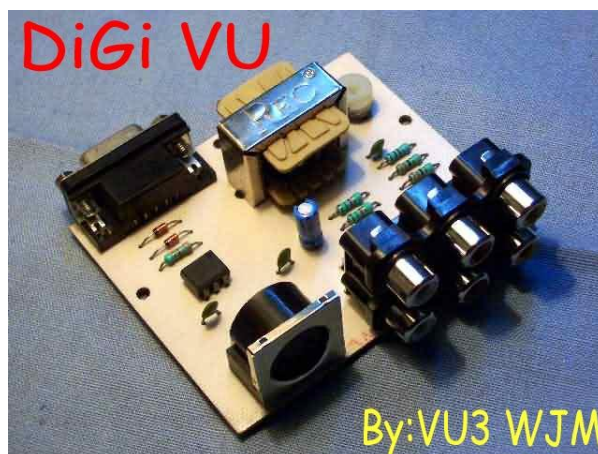
Slika 3. – Originalni sklop, izrađen od autora članka, VU3WJM