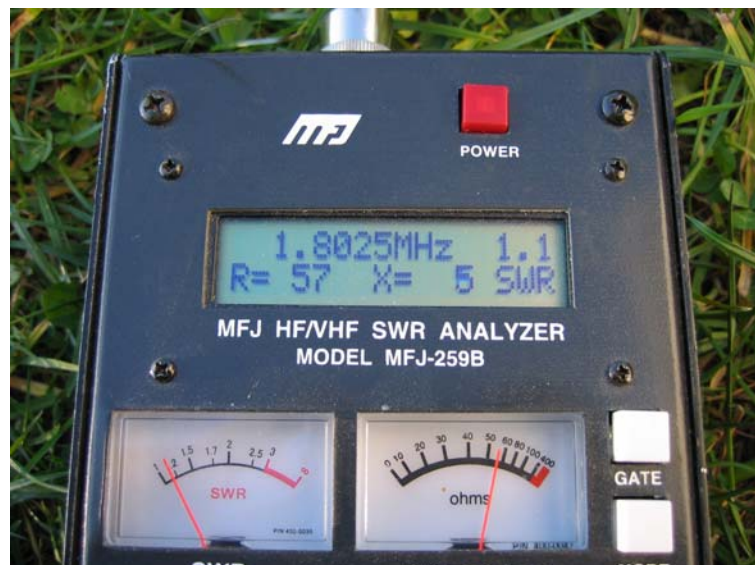
Slika 2. Podešavanje antene